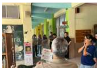
研討校園閱讀角的設置與功能性

本校校訂課程納進閱讀教學，每年搭配校訂課程小組的研討機制與課發會審查機制，讓每位老師了解閱讀教學的重點，校訂課程也搭配各項議題融入，讓學生有豐富的閱讀材料，提升閱讀興趣。