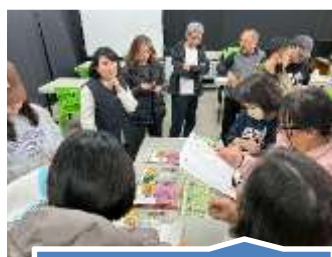
閱讀寫作教材觀摩，提升閱讀教學力