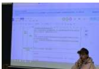
將閱讀教育納進校訂課程規劃中