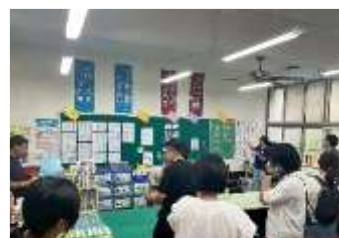
觀摩教室情境式布置，分享閱讀氛圍的建置。