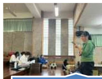
分享閱讀教學相關網站資源