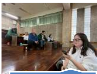
教師讀書會，帶動老師閱讀力

本校亦將讀寫教材觀摩、寫作教學、閱讀教學等納進周三研習的主題，希望透過校內外講師的引導，讓教師們看見閱讀教學的豐富樣貌，勇於嘗試與自我突破。